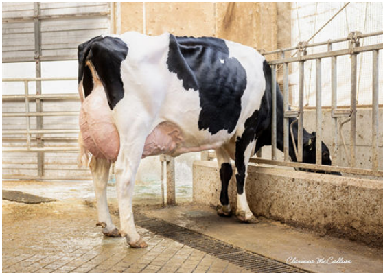
PROGENESIS ZAZZLE PRESTIGE DAM