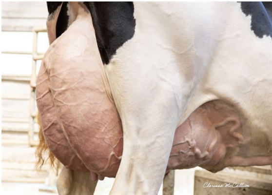
PROGENESIS ZAZZLE PRESTIGE DAM