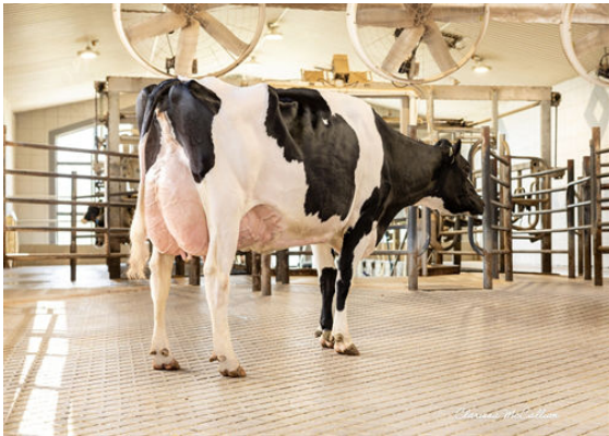
PROGENESIS ZAZZLE PRESTIGE DAM